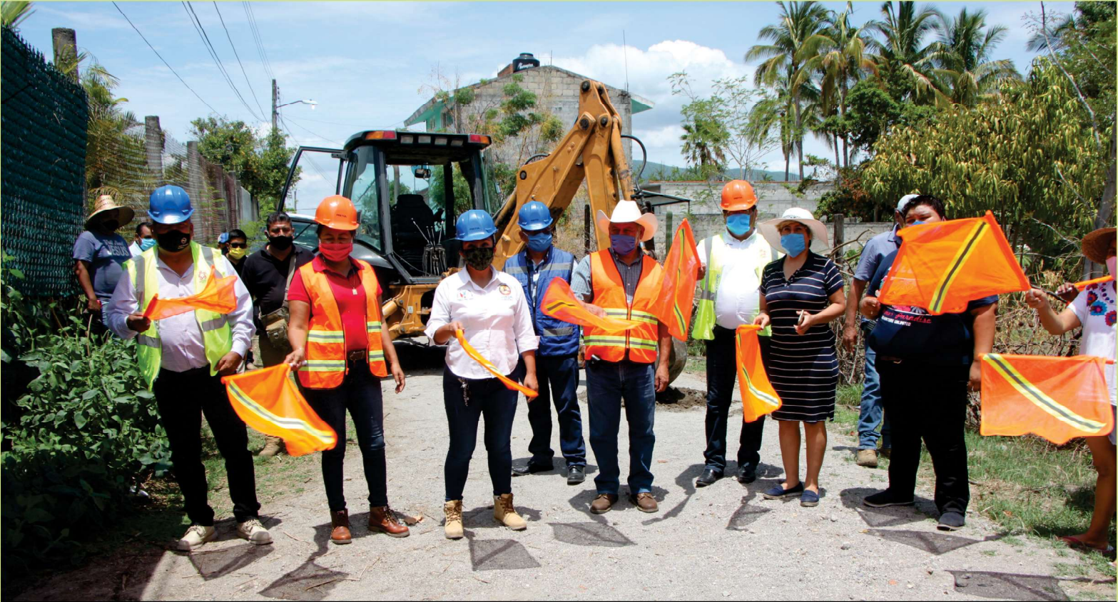
INICIO DE LA CONSTRUCCIÓN DE PAVIMENTACIÓN DE 886.80 METROS CUADRADOS EN LA CALLE JOSÉ MA. MORELOS Y PAVÓN DE LA COL. EMILIANO ZAPATA PARA BENEFICIO DE 250 HABITANTES