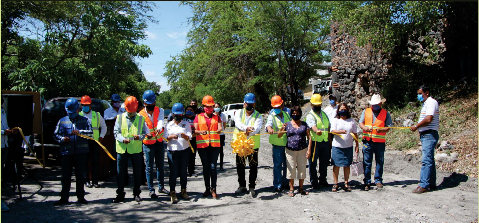
INAUGURACIÓN DE LA CONSTRUCCIÓN DEL SISTEMA DE ALCANTARILLADO 1 a y 2 a ETAPA EN LA LOCALIDAD DE AMADAOR SALAZAR