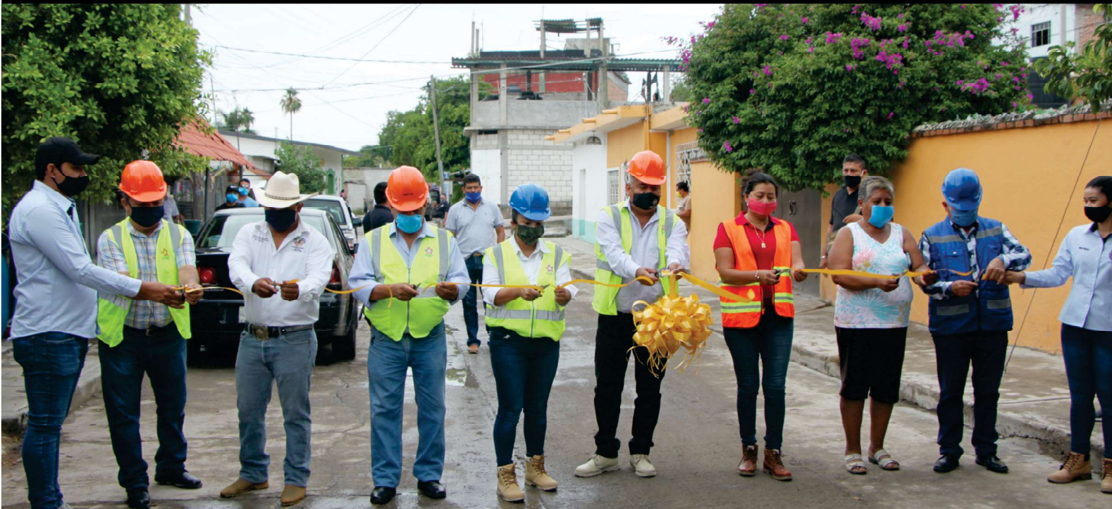
INAUGURACIÓN DEL DRENAJE SANITARIO EN CALLE, FERROCARRIL EN TICUMÁN BENEFICIANDO A 100 HABITANTES DE MANERA DIRECTA, CON UNA META ALCANZADA DE 144 METROS LINEALES ASÍ COMO DE LA CONSTRUCCIÓN DE DRENAJE SANITARIO EN CALLE, VICENTE GUERRERO DE LA MISMA LOCALIDAD QUE BENEFICIA A 48 HABITANTES CON UNA META DE 64.15 METROS.