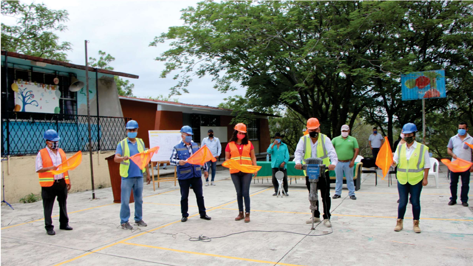
INICIO DE LA CONSTRUCCIÓN DE TECHUMBRE EN LA ESCUELA TELESECUNDARIA MARIANO MATAMOROS EN LA LOCALIDAD DE BARRANCA HONDA, PARA EL BENEFICIO DE 89 ALUMNOS Y 5 DOCENTES DE MANERA DIRECTA CON UNA META DE 483.41 METROS CUADRADOS.